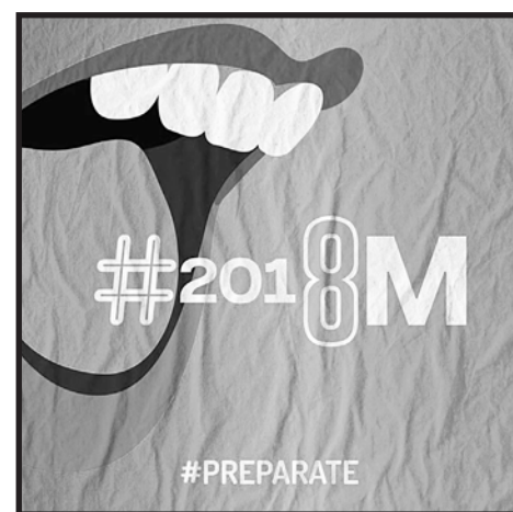
Este 8M salgamos todas a tomar las calles

constituye un plan que atenta contra las trabajadoras y los trabajadores en todo el mundo. Por eso, este próximo 8 de marzo llamamos a todas las mujeres trabajadoras a impulsar una gran jornada de lucha, con asambleas en los lugares de trabajo y estudio, con paros y otras medidas que nos permitan tomar las calles. Organizadas de manera independiente de los gobiernos patronales podremos derrotar el ajuste y avanzar en la conquista de nuestros derechos.