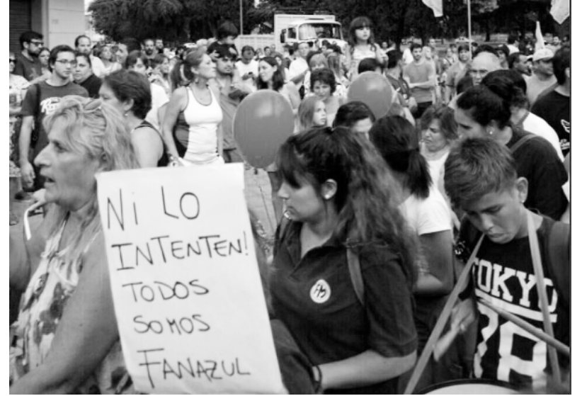
Pueblada en Azul contra cierre de fábrica y despidos

la Ciudad y hasta el Ballet Nacional de Danzas, entre otros, enfrentan la política de “reducción de personal” del macrismo. En muchas de las áreas afectadas se dieron peleas importantes con asambleas, medidas de fuerza y ocupaciones parciales de las oficinas centrales. Lamentablemente, como ya sucediera en la oleada de 2016, el hecho de pelear en forma aislada, lugar por lugar, demostró ser un método con muchísimos límites que no permite revertir la totalidad, y en algunos casos ninguno, de los despidos. Esta política de no generar una lucha de conjunto es impulsada, por acción u omisión, por los distintos sectores de las direcciones burocráticas de ATE, y se suma a la criminal división de aparato que atraviesa a la conducción de nuestro gremio. Frente a un ataque de las dimensiones aquí mencionadas, tanto la conducción nacional en manos de la lista Verde de Cachorro Godoy y Víctor De Gennaro, como la conducción de la seccional Capital en manos de los kirchneristas de la Verde y Blanca se han negado a hacer una sola movilización en conjunto. Han llegado incluso al ridículo de movilizar en el mismo lugar pero con