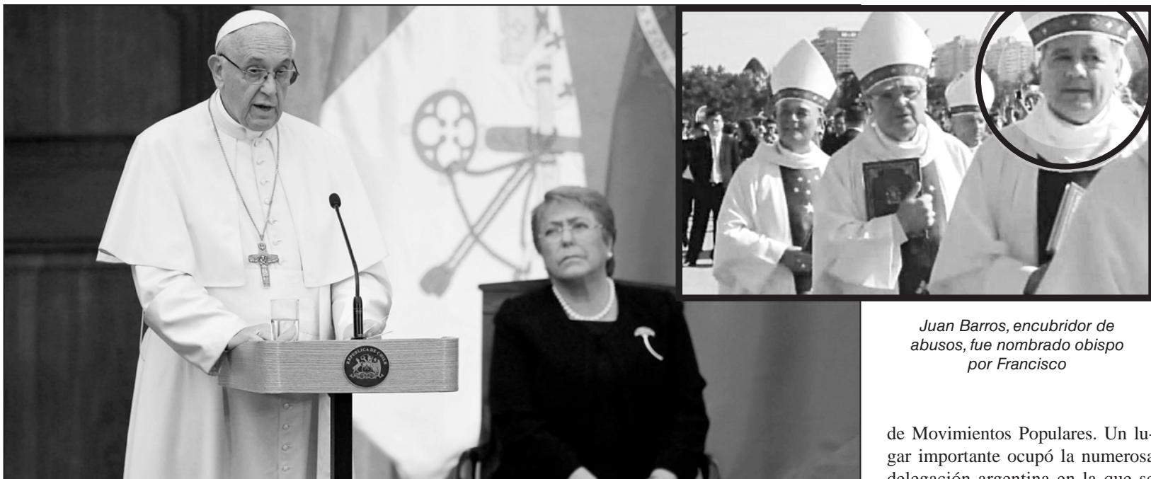
Juan Barros, encubridor de abusos, fue nombrado obispo por Francisco

La visita de Francisco a Chile ha despertado poco entusiasmo en los dos lados de la cordillera. Crecen las voces críticas por su doble discurso sobre los curas abusadores sexuales y pedófilos. “No puedo dejar de manifestar el dolor y la vergüenza que siento ante el daño irreparable causado a niños por parte de la Iglesia”. Fue el primer discurso del Papa, tratando de atenuar la indignación contra la Iglesia en Chile. Discurso cínico cuando viene de participar, en Roma, del funeral del cardenal Bernard Law, encubridor de conductas aberrantes que involucran a curas de la Iglesia Católica.