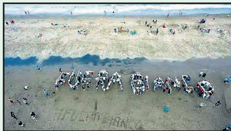
Repudio en la playa y en el domicilio donde se iba a alojar el represor Bianco