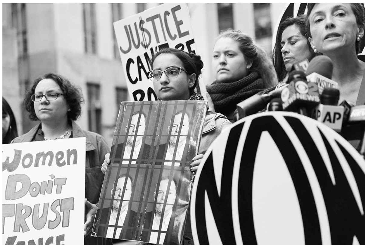
Las mujeres en todo el mundo gritan ante la impunidad frente a las agresiones sexuales

Hace pocos días el diario francés Le Monde , con la firma de cien artistas e intelectuales (como la actriz Catherine