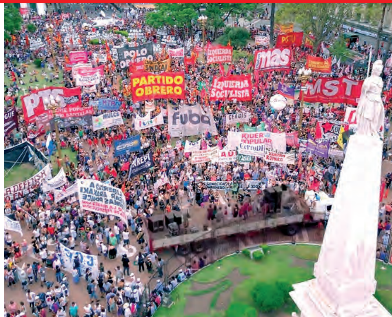
Movilización en Plaza de Mayo del jueves 11 de enero convocada por el Encuentro Memoria, Verdad y Justicia

historia familiar y comparte la decisión, a partir de la intención de beneficiarlos con el 2x1, de sumarse a la movilización por cárcel común y efectiva a los genocidas. Junto con otras ex hijas de genocidas se hicieron presentes en Mar del Plata, "para sumarnos a su lucha".