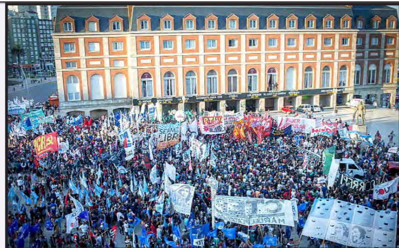
Masiva movilización en contra del genocida Etchecolatz

Frente a la política del gobierno de impunidad a los represores (son 450 las domiciliares concedidas en el último año), desde Izquierda Socialista seguiremos impulsando la movilización popular como camino para pelear por cárcel común y efectiva a los genocidas. Las jornadas de lucha en Mar del Plata condujeron a que el 12 de enero la Cámara Federal de Casación (máxima instancia en el