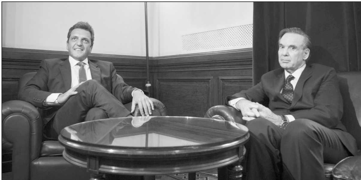
Massa y Pichetto buscan reacomodar al peronismo pensando en 2019

La política de ajustes, despidos, entrega y represión del gobierno de Macri y Cambiemos provoca cada vez más bronca y decepción en millones. Las distintas vertientes del peronismo buscan salir de la hecatombe que le generaron doce años de kirchnerismo sin resolver los problemas de la clase trabajadora y tratan de reubicarse para intentar volver a engañar al pueblo y presentarse como una opción a Cambiemos en 2019. Pero todos ellos son cómplices del ajuste.