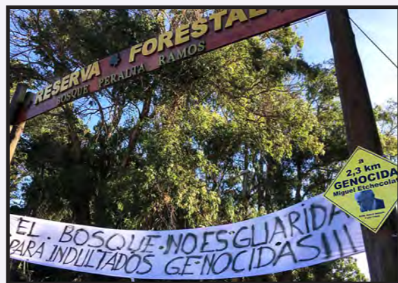
Escrache en la entrada del bosque Peralta Ramos

fue penal) rechazara el pedido de excarcelación a Etchecolatz, cuestionando los argumentos de la legitimidad de la domiciliaria. Alentamos para que el repudio popular no deje de crecer: en las últimas semanas se